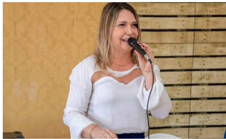
Maysa Peixoto: pronta para assumir a prefeitura