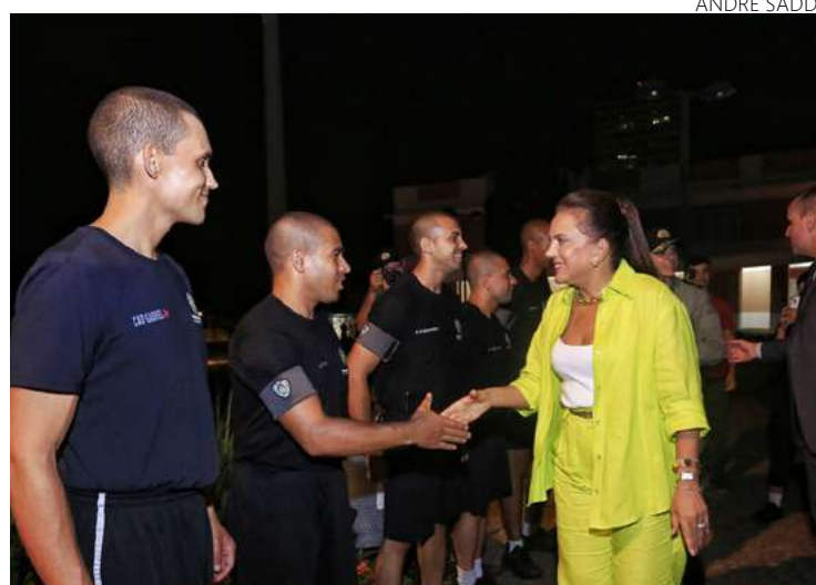
Governador Ronaldo Caiado e Gracinha receberam os alunos em formação da Polícia Militar

Para o comandante-geral da PMGO, André Avelar, os novos alunos representam os resultados dos investimentos do Governo de Goiás. “A Polícia Militar hoje vive um momento único de vontade, de motivação, de trabalho nas ruas no combate à criminalidade, graças aos investimentos do Estado e apoio do governador Ronaldo Caiado”, destacou.