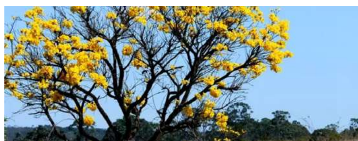
Cerrado goiano: pesquisa anual Prodes Cerrado atesta que Goiás foi estado com maior redução de desmatamento

Em setembro, o Governo de Goiás assinou junto a entes