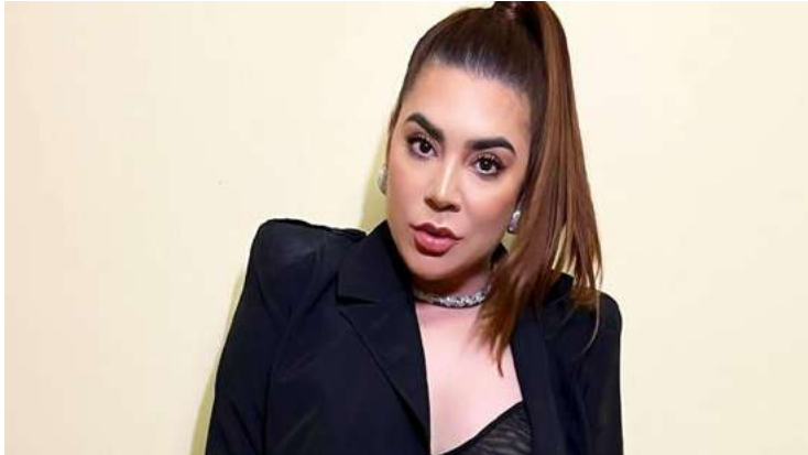
Socorro: cantora foi atendida e caso encaminhado à Deam

Ex-participante do Big Brother Brasil, Naiara Azevedo alega ter sido vítima de violência doméstica