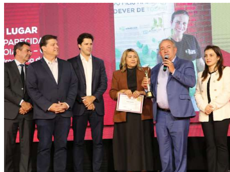
Projeto de Reestruturação Urbana da Bacia do Ribeirão Santo Antônio foi o escolhido dentre cinco cidades nacionais. Cidade também foi destaque no quesito sustentabilidade