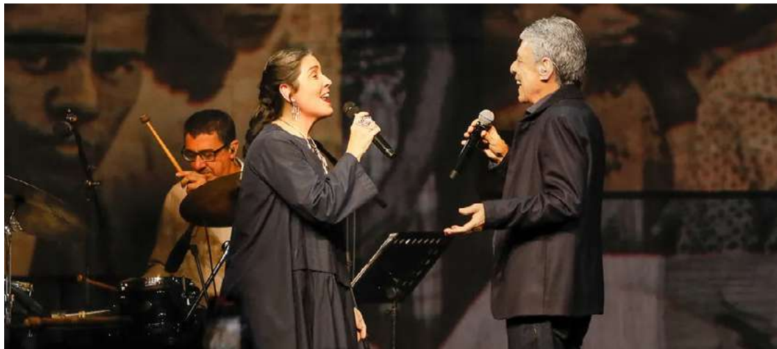
Mônica Salmaso e Chico fazem bela parceria em álbum

Palavras: Chico Buarque é cronista de tantas sensações vividas pelos fãs